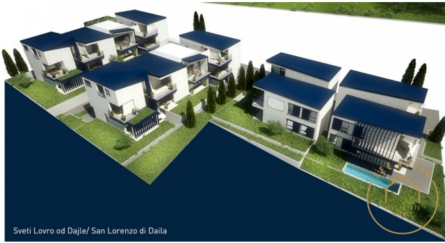
Sveti Lovro od Dajle/ San Lorenzo di Daila

NOVA GRADNJA d.o.o. Stancija Vinjeri 24 E, 52466 Novigrad mail: info@seeadria.com web: www.seeadria.com info: +385 99 5359 152