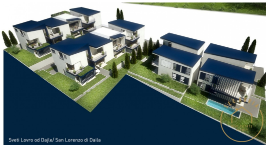
Sveti Lovro od Dajle/ San Lorenzo di Daila